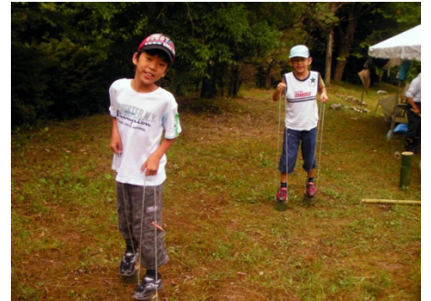
天理ダム上流での竹細工づくり（左：テント内の工作のようす、中央：講師による指導、右：完成竹細工で遊ぶ）。