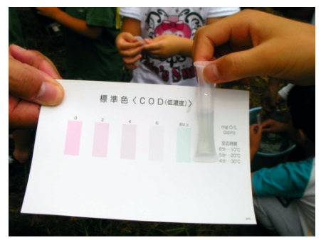
天理ダム上流での水質調査（左：講師から説明を受ける、中：COD値 4ppm、右：COD値 8ppm 以上）。 当日は小雨模様のため、上流から流れてきた濁った水が“汚れ度”を高めたと考えられた。