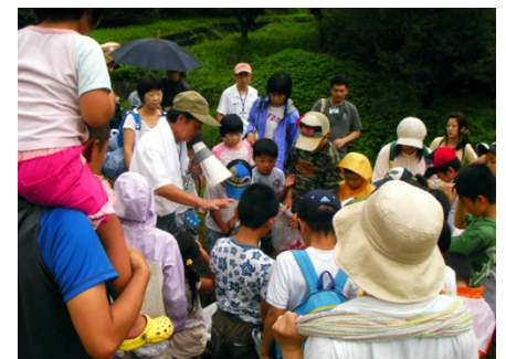
天理ダム上流での生き物調査(左:調査のようす、中:川の中で調査、右:講師から説明を受ける)。